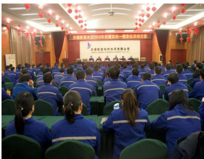
安标创建启动大会

本年度公司积极创建安全标准化一级企业,将安全工作落实到各个方面,确保人员安全、设备安全。